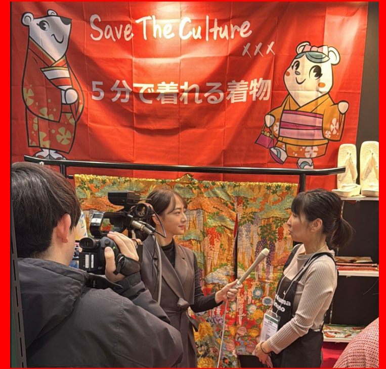
17日 (金) TOKYO MX 番組おはりナ! 1月24日 (金)