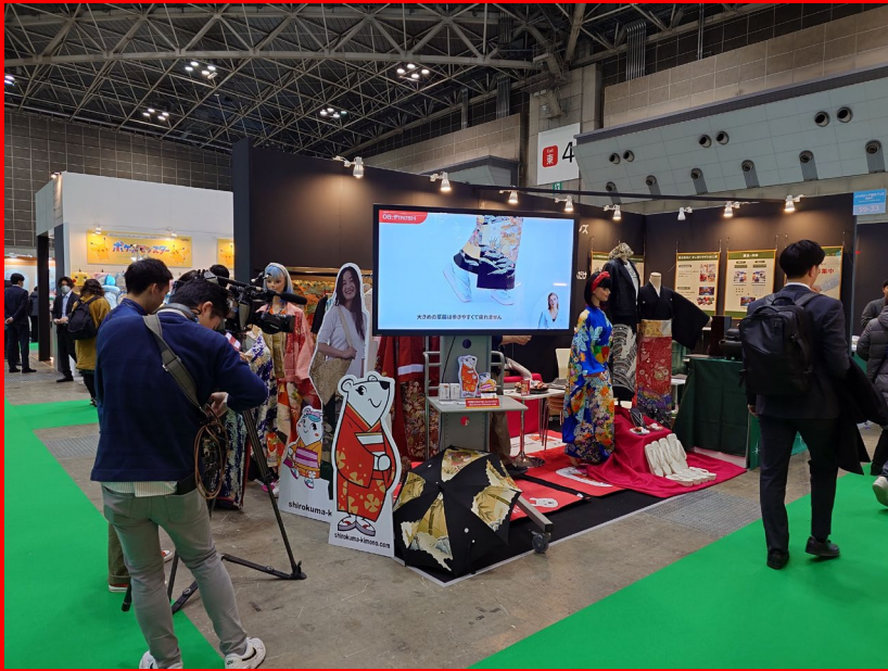
15日 (水) TV asahi 報道