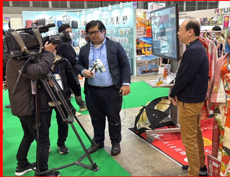
16日 (木) TOKYO MX 報道